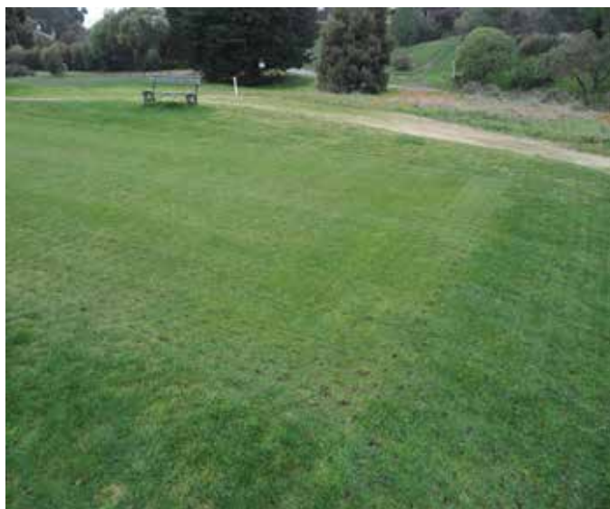
Resultado de aplicación de AQUAVIVA® con el tracto en Club de Golf