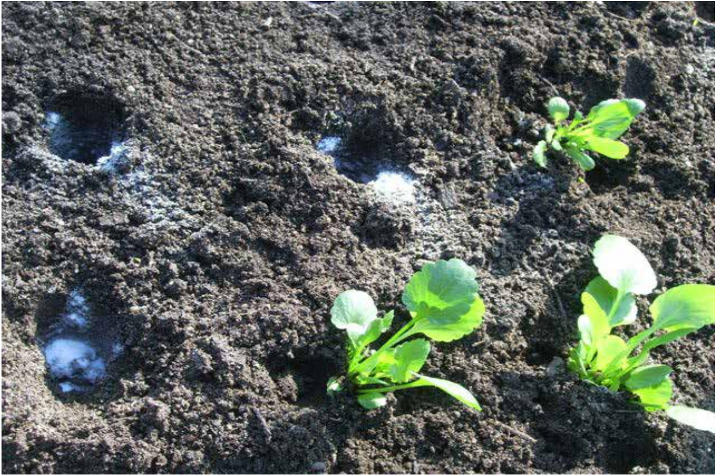
Agujero en la tierra para raíces.