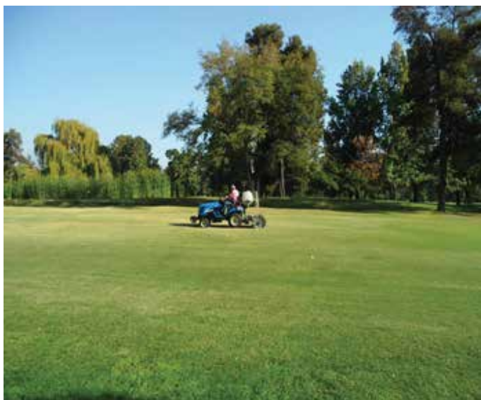
Aplicando AQUAVIVA® en Sport Francés

PARA INSTALAR EN SUPERFICIES COMO CÉSPEDES, PASTOS Y APLICACIONES DE SUPERFICIE YA PLANTADAS, CONTAMOS CON ESTE TRACTOR QUE NO SÓLO INYECTA EL AQUAVIVA® SINO TAMBIÉN FERTILIZANTES Y OTROS.